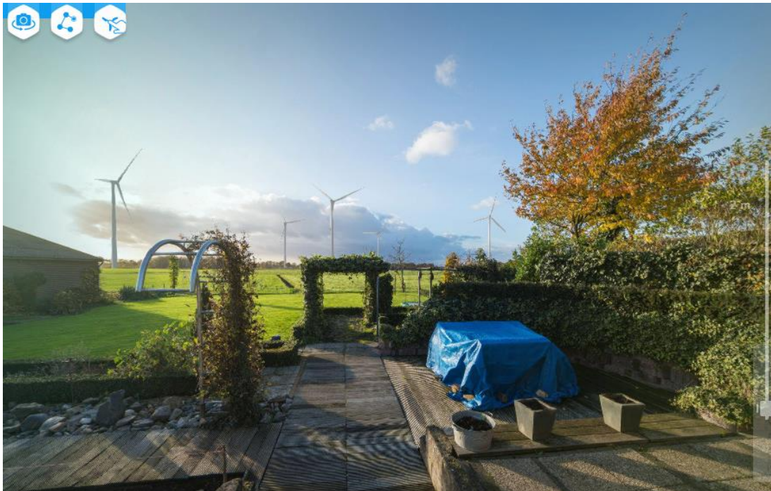
Foto 4: Visualisatie vanuit gezichtspunt Dooleggersbaan (op 395 m van dichtstbijzijnde turbine)