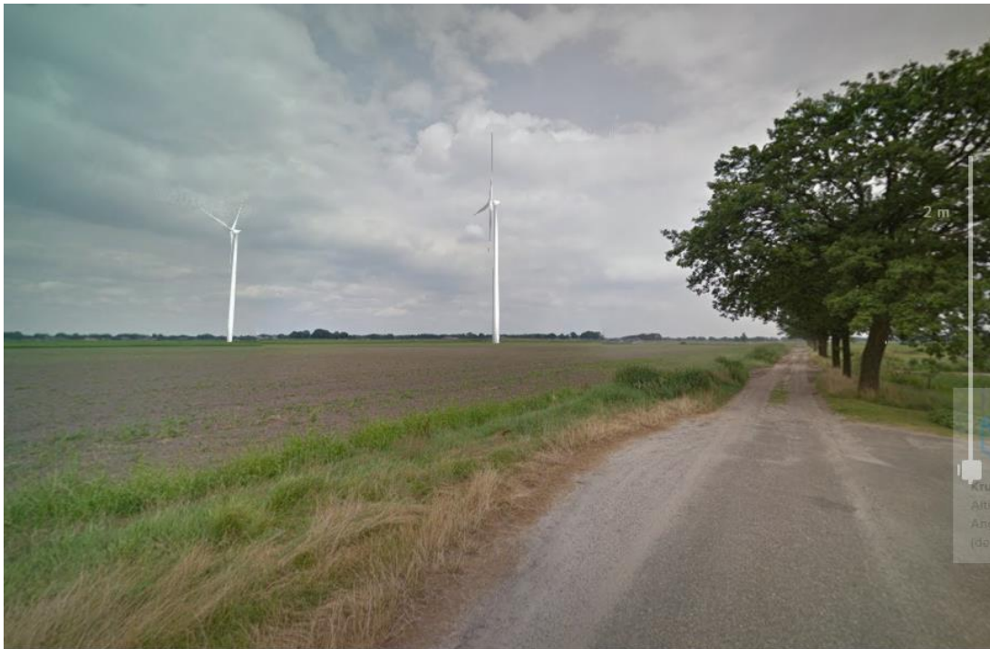
Foto 6: Visualisatie vanuit gezichtspunt Kerkendijk op 852 m van dichtstbijzijnde turbine).