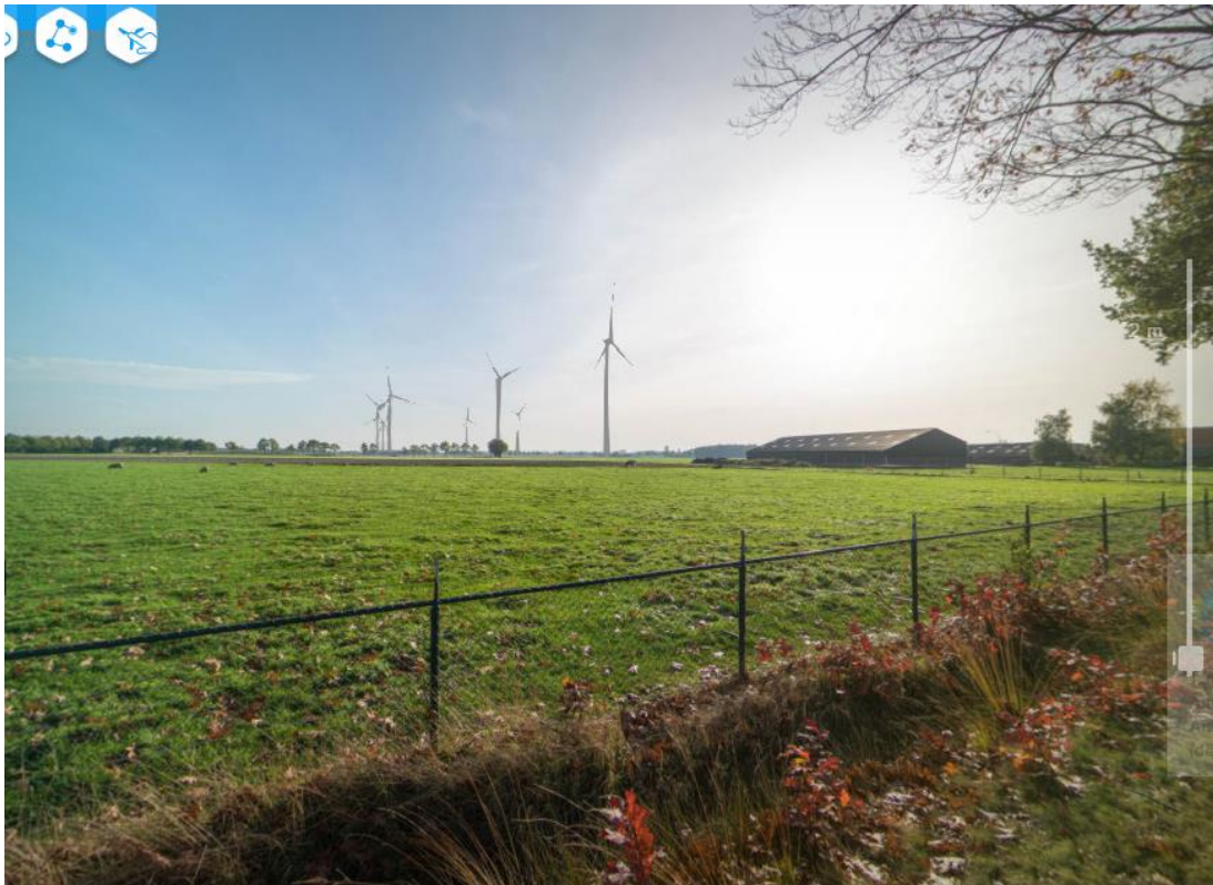
Foto 2: Visualisatie vanuit gezichtspunt Groesbaan (op 490 m afstand van dichtstbijzijnde turbine)